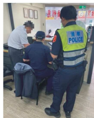
三重警分局自4月份以來共查有19間當舖違反相關規定共達31項。