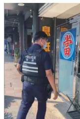
三重警分局貫徹「清源2.0」，挖掘轄內幫派分子經營、依附、圍事及行業，執行掃蕩查緝，違規營業場所。