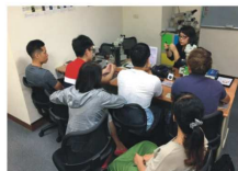
鑽石訓練班上課情況