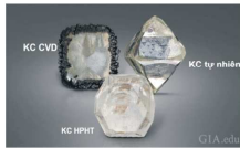
八面體是天然鑽石的原礦、方型外圍黑碳結晶是CVD合成法鑽石、前面是IHPHT合成法實驗室鑽石。科技日新月異，這三顆磨出來在一般儀器下都顯示真鑽，你如何分辨？